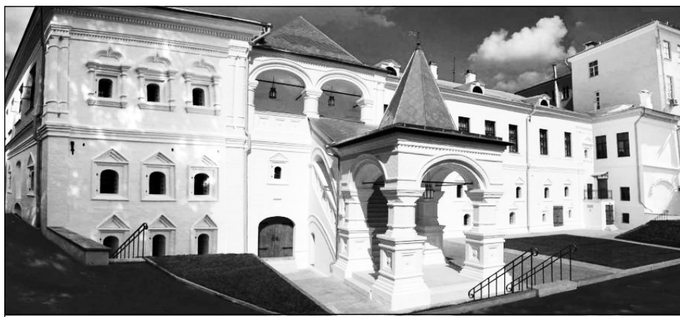
Международный Центр-Музей имени Н.К. Рериха, западный фасад главного дома с крыльцом XVII века после реставрации

Дорогие друзья! В нашем распоряжении оказалось письмо первого заместителя министра культуры РФ В.В. Аристархова о судьбе «общественного» Музея имени Н.К. Рериха – в оригинале письма статус Музея заключен в кавычки. В нем говорится о том, что создание государственного «музея семьи Рерихов обеспечит широкий доступ к художественному наследию и архивным фондам семьи Рерихов. Одним из основных направлений работы музея будет конструктивное взаимодействие с гражданами, интересующимися наследием Рериха» [1].