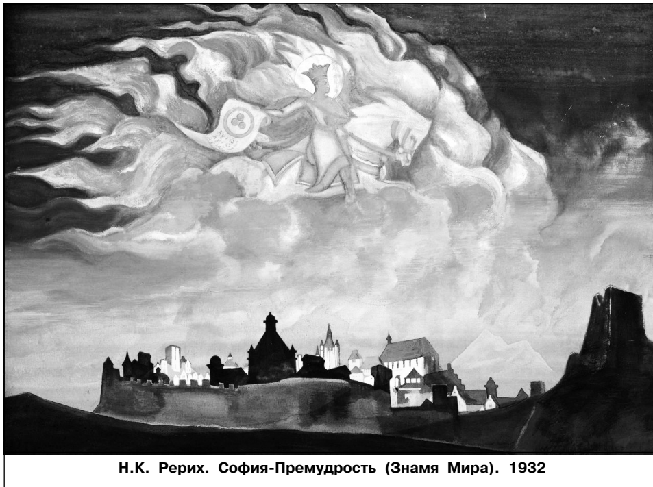
Н.К. Рерих. София-Премудрость (Знамя Мира). 1932