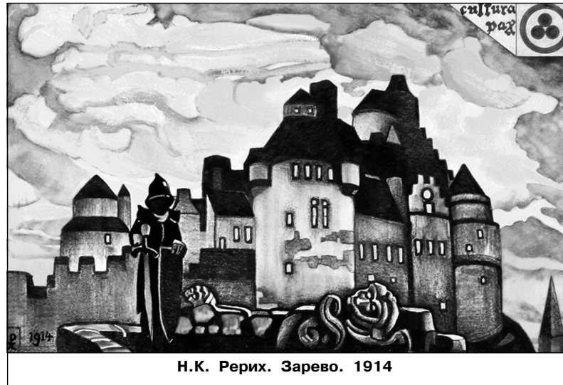
Н.К. Рерих. Зарево. 1914

чем сам человек в своих представлениях – это естественная потребность человеческой души. И молодежь находит свои идеалы. Девочки – в звездах шоу-бизнеса, артистах, фотомоделях, мальчики – в сильных и волевых, с их точки зрения, бородастых людях с автоматами Калашникова.