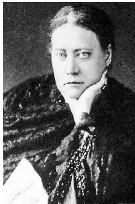
Елена Петровна Блаватская. 1876 – 1878 гг.

В нынешнее армагеддонное время особенно необходимо, чтобы все философские, духовные и культурные общества держались в полном единении. Когда мир весь сотрясается от человеконенавистничества, то все, которые считают себя принадлежащими к культуре, должны быть воедино, вместе. Никакие соображения не могут оправдывать разрушительных делений. При всех мировых потрясениях прежде всего страдает