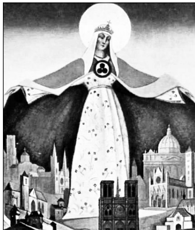
Н.К. Рерих. Мадонна Защитница. Фрагмент. 1931

4 февраля 2016 года в выставочном зале города Междуреченска Кемеровской области состоялось открытие выставки «Пакт Рериха. История и современность». Выставка организована в рамках одноименного международного выставочного проекта, приуроченного к 80-летию подписания Договора об охране художественных и научных учреждений и исторических памятников, вошедшего в историю как Пакт Рериха. Проект организован Международным Центром Рерихов и Международным Комитетом по сохранению наследия Рерихов при поддержке ЮНЕСКО и Министерства иностранных дел Российской Федерации.