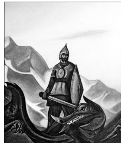
Н.К. Рерих. Победа. Фрагмент. 1942

«Зачем я шел в тебя, Россия?» – пели германские пленные офицеры, проходя по улицам Сталинграда. Так передавало Московское радио. Победа, огромная победа! Вспомнили мой листок «Не замай!», писанный до войны. Поистине «Не замай!» Россию. Каждый посягнувший на нашу Родину погибнет с несмысленным позором.